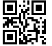
رمز ثنائي الأبعاد

ويوجد نوعان رئيسان من رموز "باركود"، رمز أحادي البعد أو خطي و هو الأكثر انتشارا و ينقسم إلى عدة أنواع (مثل رمز 128 ، و رمز UPC) ورمز ثنائي الأبعاد والذي يمكن أن يحوي معلومات أكثر أو صور أخرى (مثل رمز QR).