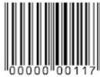
رمز أحادي البعد