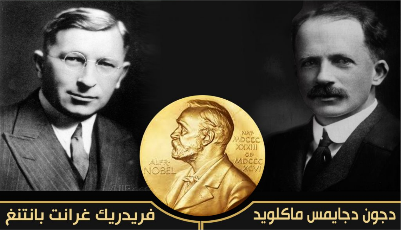
فريدريك غرانت بانتنغ