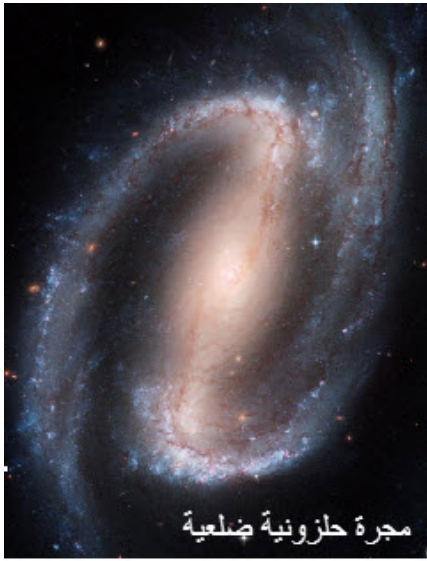
مجرة حلزونية ضلعية