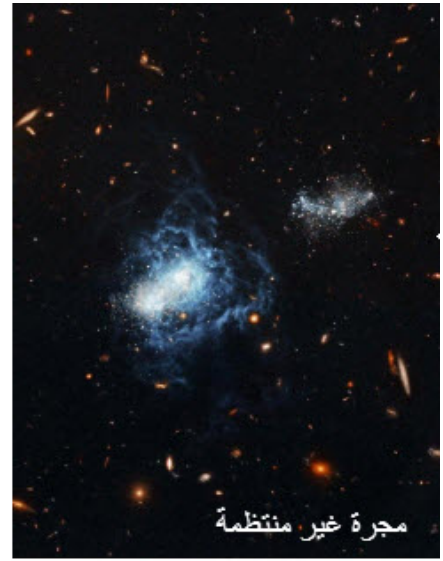
مجرة غير منتظمة