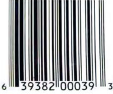
مثال لرمز باركود

وللتوضيح أكثر في الصورة جانبه الستة أرقام الأولى من اليسار "639382" تمثل رقم التعريف الخاص بالمنتج أو المصنع و العدد 6 في أول الرقم يمثل نوع السلعة (مثلا 3 تمثل السلع الصيدلية) والأرقام "39382" تكشف عن هوية المصنع أما الخمس الأرقام التالية "00039" فتمثل رقم هوية المنتج والرقم الأخير "3" فهو ناتج عملية حسابية محددة يقوم بها قارئ رموز "باركود" للتأكد من صحة وسلامة و اتجاه القراءة، ويمكن أن يتغير الرقم التعريفي لمنتج معين حسب حجم التغليف و نوعه و كمية المنتج، فمثلا قنينة مشروب غازي سعتها لتر واحد لشركة "كوكاكولا" تحمل رقما تعريفيا للمنتج مختلفا عن قنينة "كوكاكولا" سعتها نصف لتر.